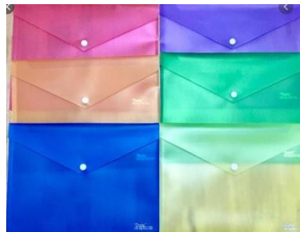
Contoh Map Tas Plastik

Nama : Ahmad Asal SMP : SMPN 1 Lumajang No HP : 087846356809 Pilihan Jurusan : 1. ATU 2. ATPH